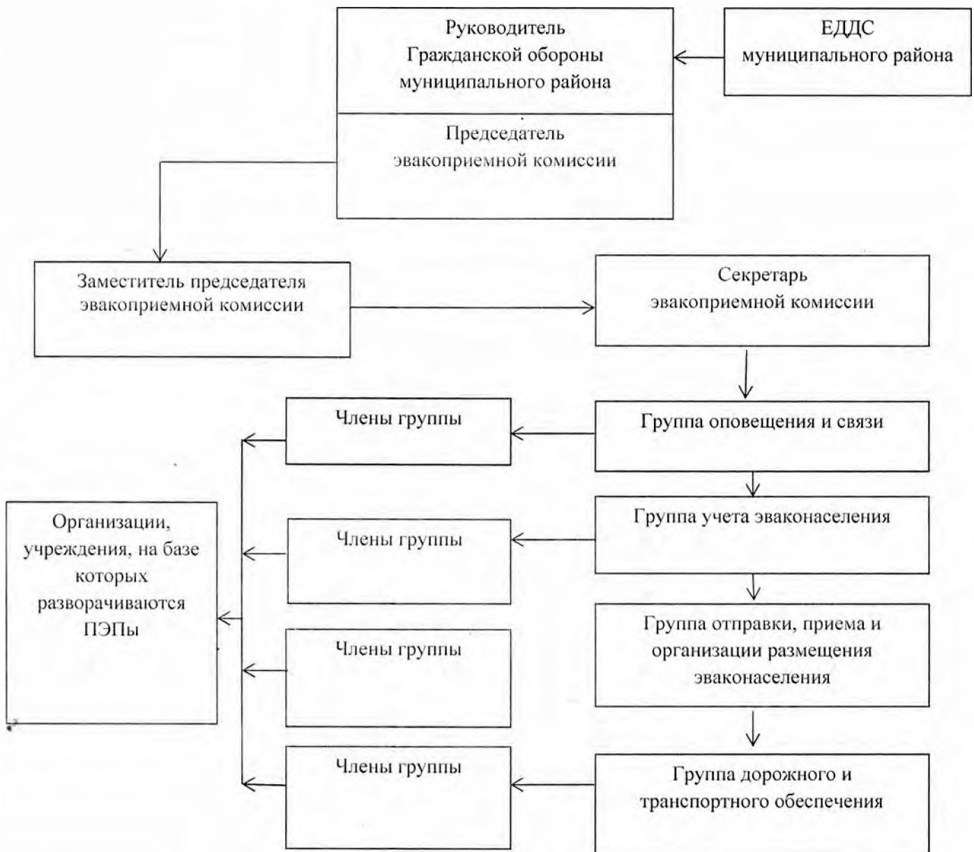
Схема организации оповещения Приемной эвакуационной комиссии

Утверждена постановлением администрации МР «Казбековский район» от 21.07.2025 № 119